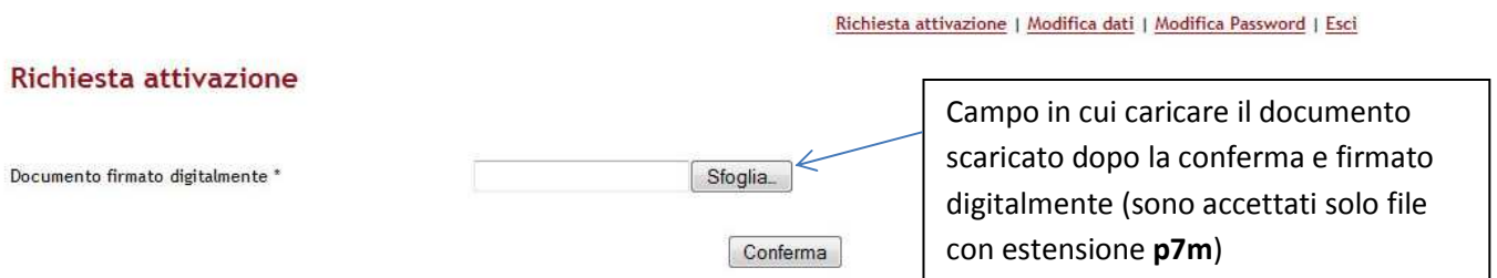
Fig. 5: Pagina attivazione

Alla fine dell'attivazione il referente dell'impresa riceverà un'email di conferma dell'avvenuta attivazione.